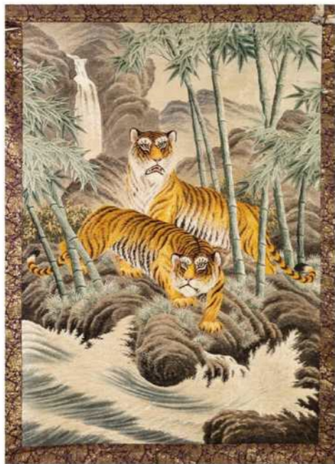
▲竹林に双虎 (旧幕) / 年代不明 / 愛荘町岩倉