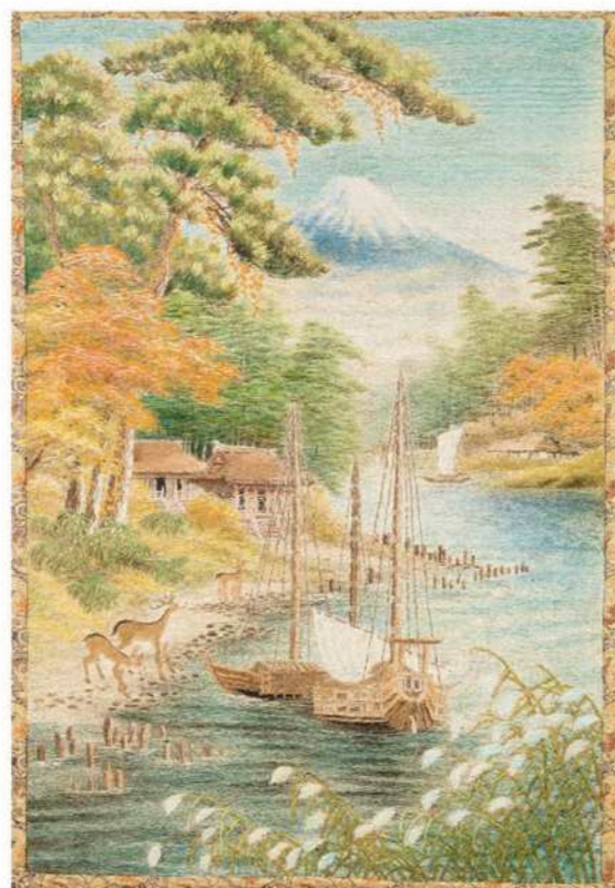
▲富士に舟、山水図（現行幕）／大正5年／愛荘町東出