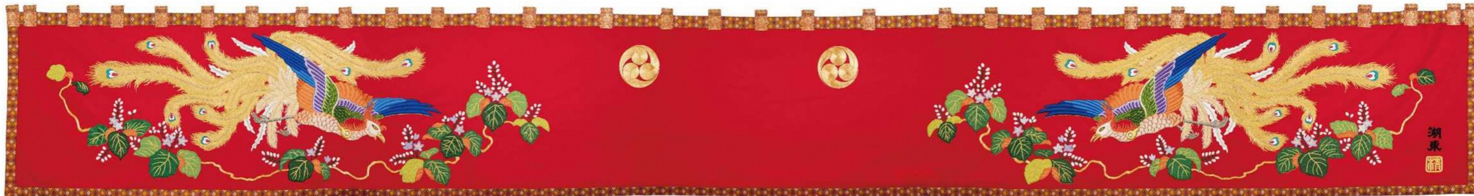
▲桐に鳳凰／令和元年／静岡県磐田市坂上町心誠社

滋賀県では春祭りを盛大に行なう地域が多く、華やかに装飾した曳山が巡行する様子を各地で見ることができます。愛荘町・軽野神社（堅井之大宮）の春大祭でも九つの集落から曳山が出て町内を巡行します。この曳山の背面に飾られる見送幕には、虎や孔雀・獅子などが刺繍によって描かれ、祭りを絢爛豪華に彩ります。