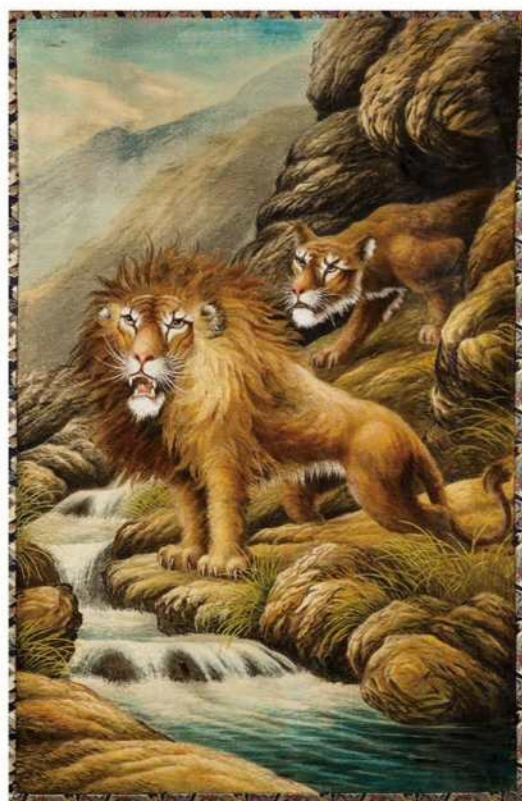
▲溪谷に双獅子（現行幕）／大正12年／愛荘町円城寺

堅井之大宮春大祭の見送幕をすべて集め、前期・後期に分けて展示いたします。また、祭りでもめったに見ることのできない旧幕も公開されます。近年の病禍により祭りが中止され、2年間見ることのできなかつた見送幕を博物館でゆっくりとご覧下さい。