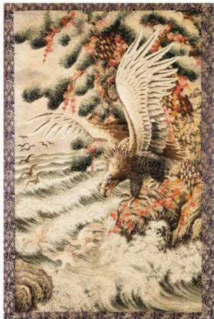
▲松に鷹、岩、波、海鳥 (現行幕) / 大正13年 / 愛荘町松尾寺北

会 期：令和3年10月23日(土)~12月12日(日) 前期:10月23日(土)~11月21日(日) 後期:11月22日(月)~12月12日(日) 開館時間：10:00~17:00(入館は16:30まで) 休館日：月・火曜日(11月は毎日開館) 入館料：一般300円(250円)小・中学生150円(100円)※( )内は20名以上の団体料金 無料入館日：令和3年11月20日(土)~23日(火・祝) 特別協力：(有)青木刺繍 磐田市坂上町・心誠社 津島山車保存会 堅井之大宮見送幕所有集落 後援：NHK大阪放送局 朝日放送 朝日新聞大阪総局 京都新聞 産経新聞社 滋賀報知新聞社 中日新聞社 毎日新聞大阪支局 読売新聞大阪支局