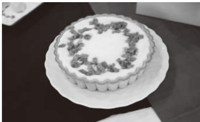
▼山芋チーズタルト

中ホールでは地域安全功労・地域安全ポスターコンクール表彰式が開催されました。また、駐車場では警察・自衛隊・消防などの車両が集まり、車両と一緒に写真を撮ってオリジナルの缶バッジを作るイベントが行われました。子どもたちは車両に乗ったり、写真撮影したりして「いい体験ができた」と話していました。