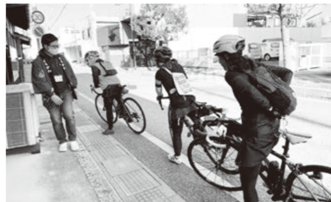
▼チェックポイントを巡るモニター参加者