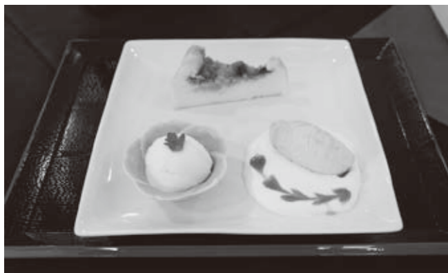
▼あいしょうスイーツドリンクセット