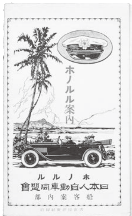
▲パンフレット「ホノルル案内」

会期：3月21日(月・祝)まで 会場：歴史文化博物館 企画展示室 開館時間：10:00～17:00(入館は16:30まで) 休館日：月・火曜日(祝日は開館)・2月24日(木) 入館料：町内在住の方は無料 展示解説：2月20日(日)・3月20日(日) 各日11:00～14:00～