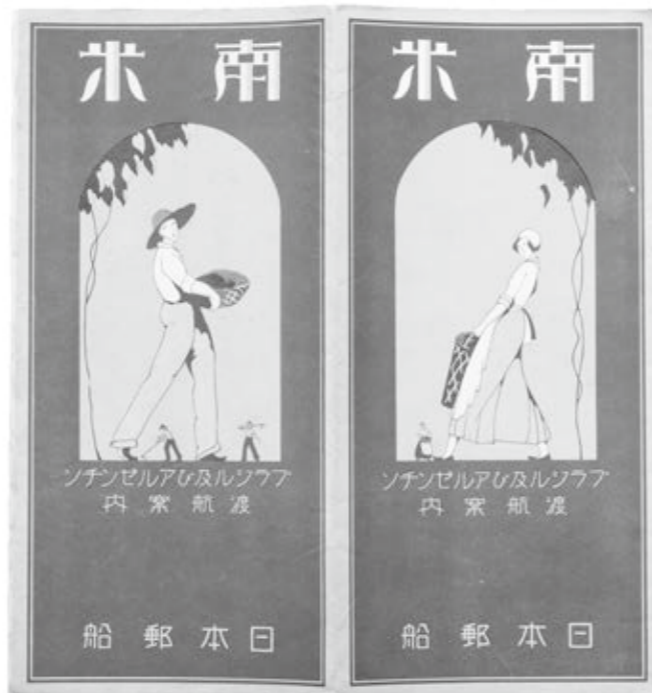
▲パンフレット「南米」

展覧会では、近代に発行された日本の名所を描いた絵葉書や、海外旅行のパンフレットを展示します。併せて絵葉書に描かれた近江の名所の現在の写真も紹介しますので、時代の変化や旅の思い出を懐かしみながらお楽しみください。