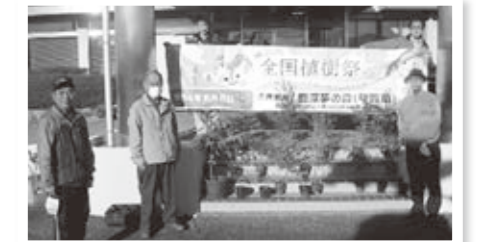
▲「苗木のホームステイ」苗木引渡し

愛荘さくらを守る会は、2年9か月にわたリクヌギやコナラなどの5種類の苗木を育成されました。ありがとうございました。