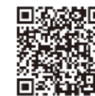
▲詳細はこちらから