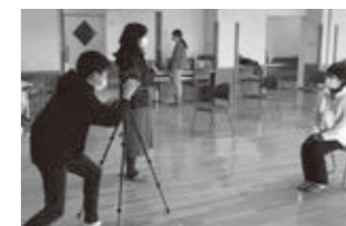
▲スポーツ庁撮影の様子