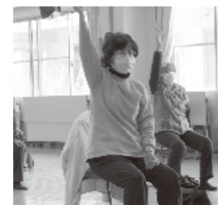
▲健康元気もりもり教室