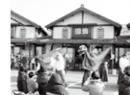
▲昨年の伊勢大神楽の様子

また、2月26日(日)は、恒例のあいしょう朝市です。採れたての野菜をはじめ、手芸・木工・手作りアクセサリーなども出店予定です。お楽しみに♪