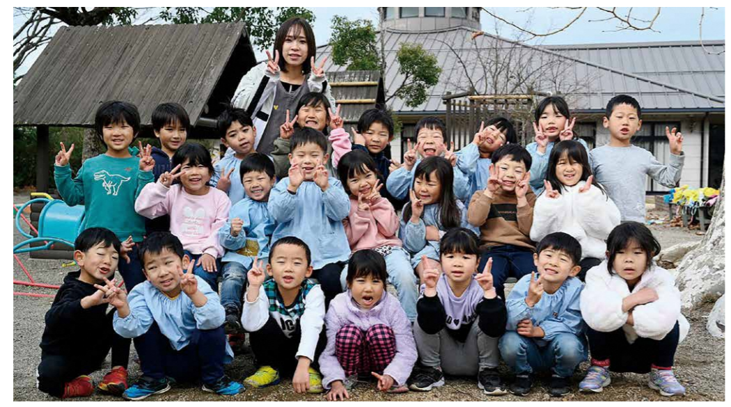
秦川保育園 ぞうぐみ（5歳児クラス）

元気いっぱい！毎日にぎやかでとっても楽しいぞう組23名です。保育園での生活もあと少し。いっぱい遊んで、いっぱい笑って、たくさん思い出つくりたいね！