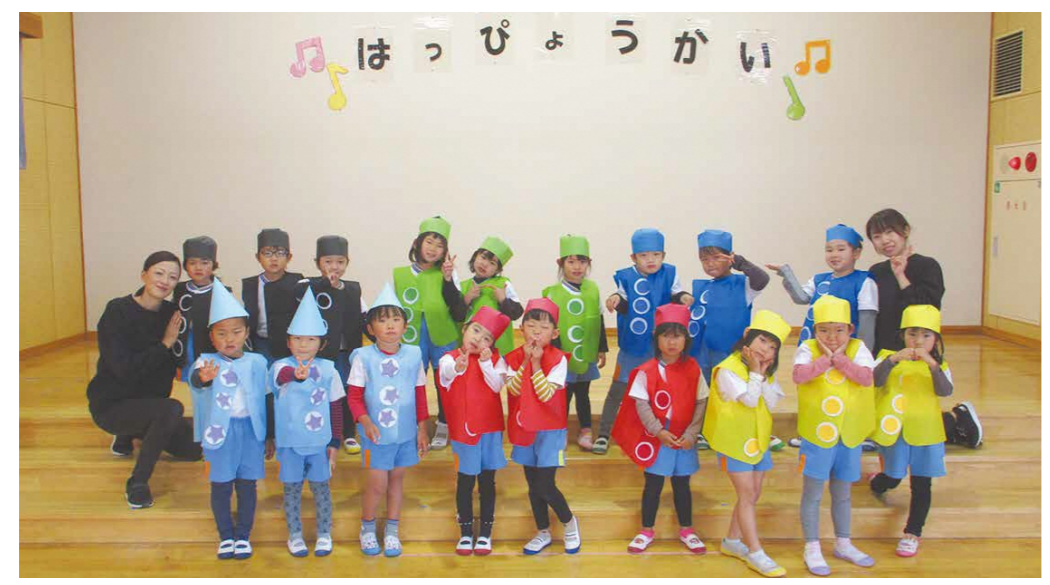
秦荘幼稚園 いちごぐみ（4歳児クラス）

友だちや先生と遊ぶことが大好きないちご組さん。運動会や発表会等の大きな行事を通して心も体もぐ〜んと大きく成長しました。これからも元気いっぱい！いろいろなことにチャレンジしていこうね。