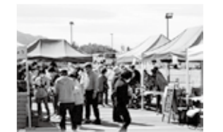
▲毎月第4日曜日に開催「あいしょう朝市」

☎ 湖東三山館あいしょう(名神湖東三山 SIC 進入路角、愛荘町松尾寺 1395-1) ☎0749-37-2333