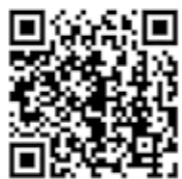
▲詳細はこちらから