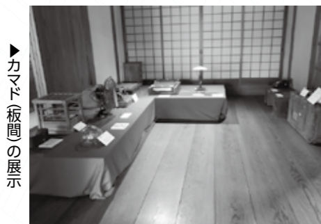
▶カマド板間の展示