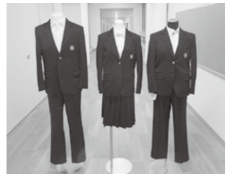
新制服（愛知中学校）