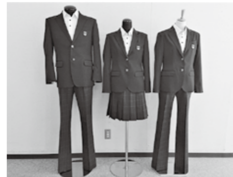
新制服（秦荘中学校）