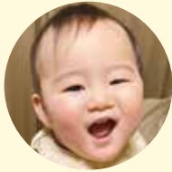
ところ せん り 所泉李ちゃん