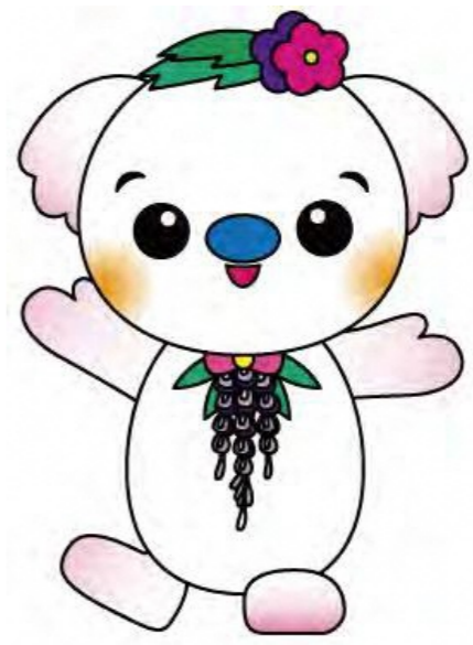
甲良町のキャラクター ココラちゃん