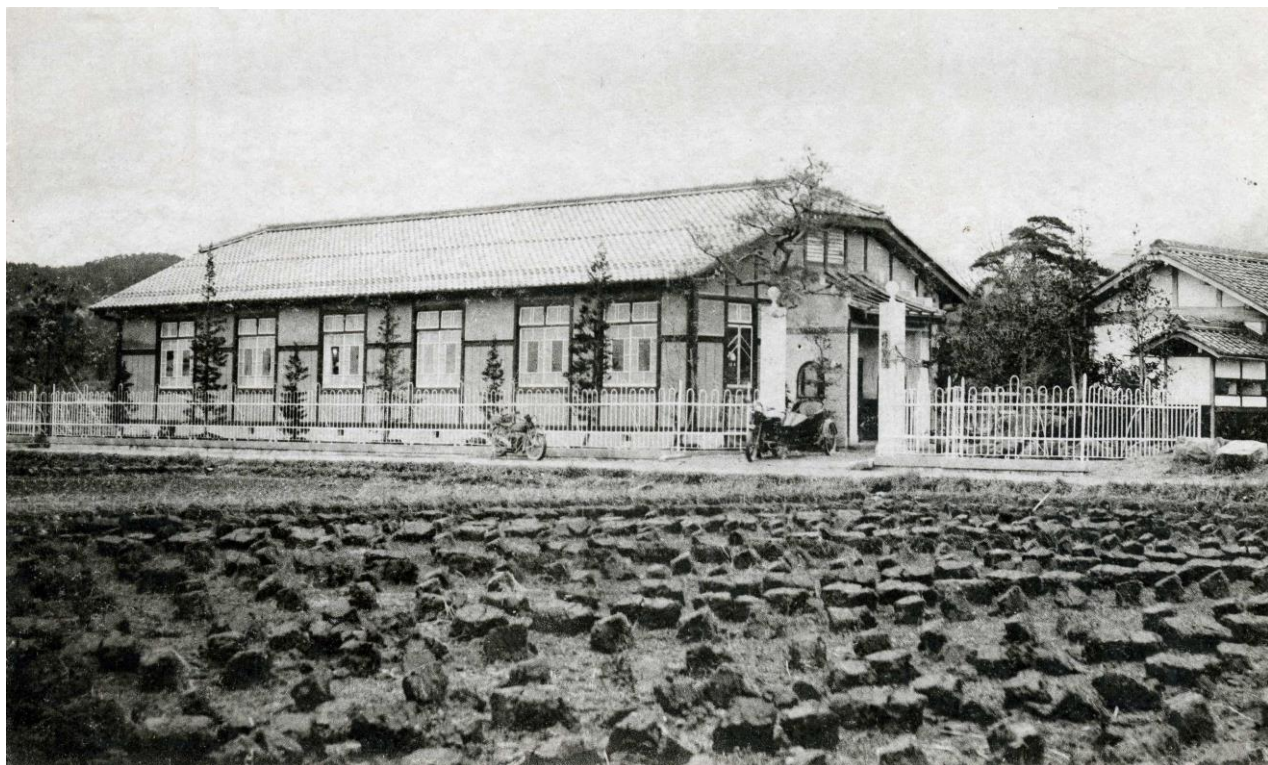
北村医院(愛荘町蚊野)

日本に西洋医学が入ってきた明治時代から昭和にかけて、医院を開業し、地域の人々の健康を支えてきた家がありました。愛荘町の医院の歴史をパネル展示でたどります。