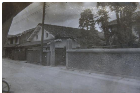
旧成宮医院(愛荘町愛知川)