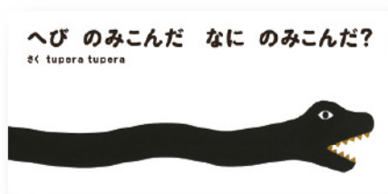
『へびのみこんだ なにのみこんだ?』 (えほんの社 / 2011年)

|| tupera tuperaの絵本 || 3つの絵本原画とこれまで出版された絵本を展示します。