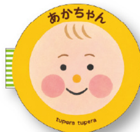
『あかちゃん』 (ブロンズ新社 / 2016年)