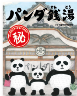
『パンダ銭湯』 (絵本館 / 2013年)