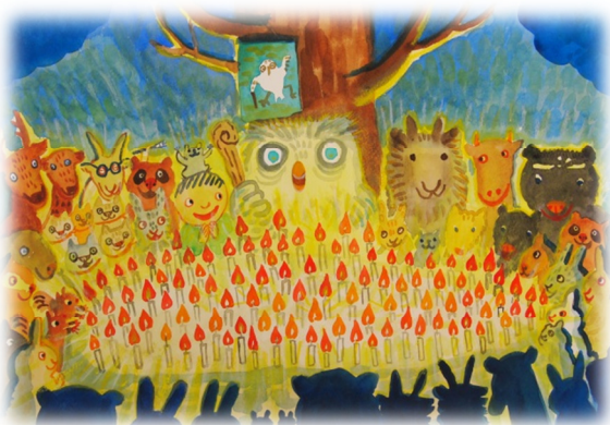
『ろうそくいっぼん』より