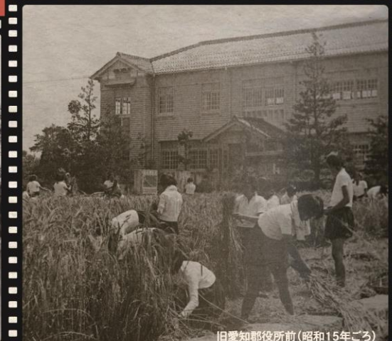
旧愛知郵便所前(昭和15年ごろ)