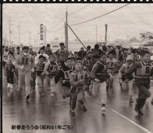
新春走ろう会(昭和61年ごろ)