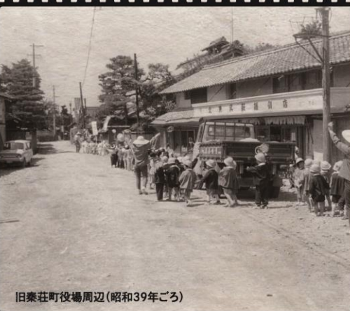
旧秦荘町役場周辺(昭和39年ごろ)