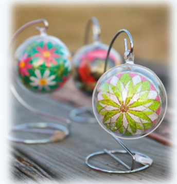
びんの中にてまりを封じ込めた不思議な工芸品「愛知川びん細工手まり」 吊り下げ型の小さいびん（直径9センチ）で作る“初心者向け”の教室です。