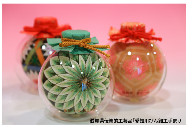
滋賀県伝統的工芸品「愛知川びん細工手まり」

〒529-1313 滋賀県愛知郡愛荘町市 1673 TEL 0749-42-4114 FAX 0749-42-8484