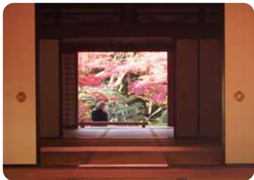
桃山から江戸時代中期にかけて作庭された国指定の名勝庭園