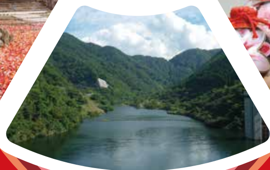
宇曾川ダム からの 展望