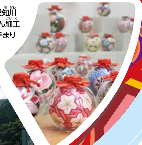
愛知川 びん細工 手まり