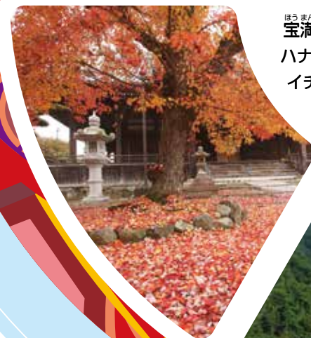
宝満寺の ハナノキ・ イチヨウ