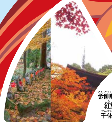
金剛輪寺の 紅葉と 千体地藏