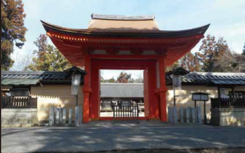
〔住所〕愛荘町豊満392番地

豊満神社には首長竜に似た木があるそうです。その木は何百年もかけて恐竜に似た木になったそうです。木の肌も恐竜に似ているので、ぜひ探しに行ってみてね!