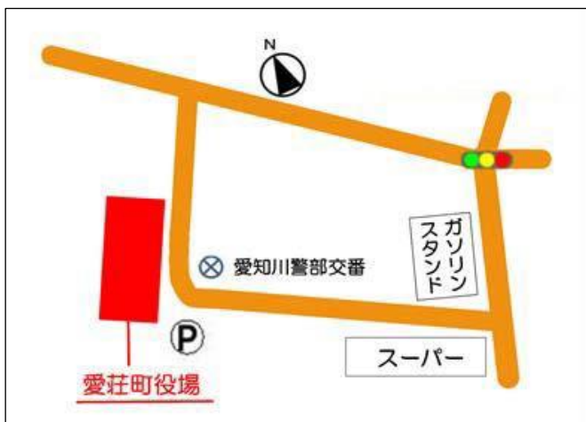
【愛荘町役場位置図】